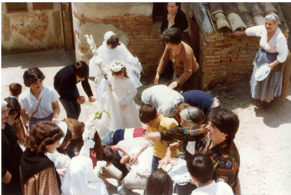
Prime comunione a Makij In Via Suliuti - [Foto 1979]