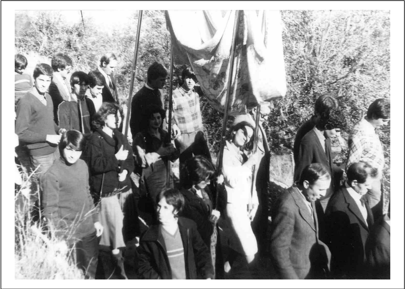
Processione religiosa a Makij a nord del Corso Jeronim Radanjvet [Foto anni 1960 - 1970]