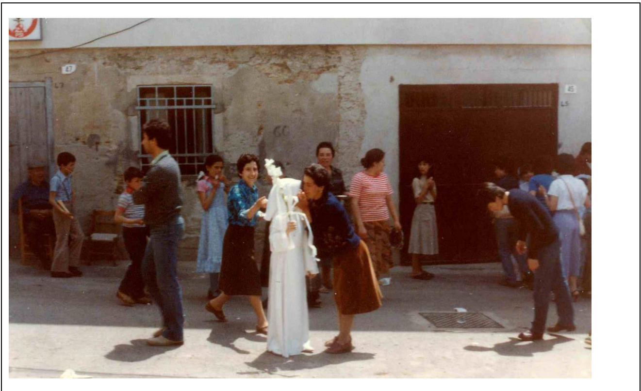
Prime comunioni a Makij in Corso Jeronim Radanjvet - Foto 1979