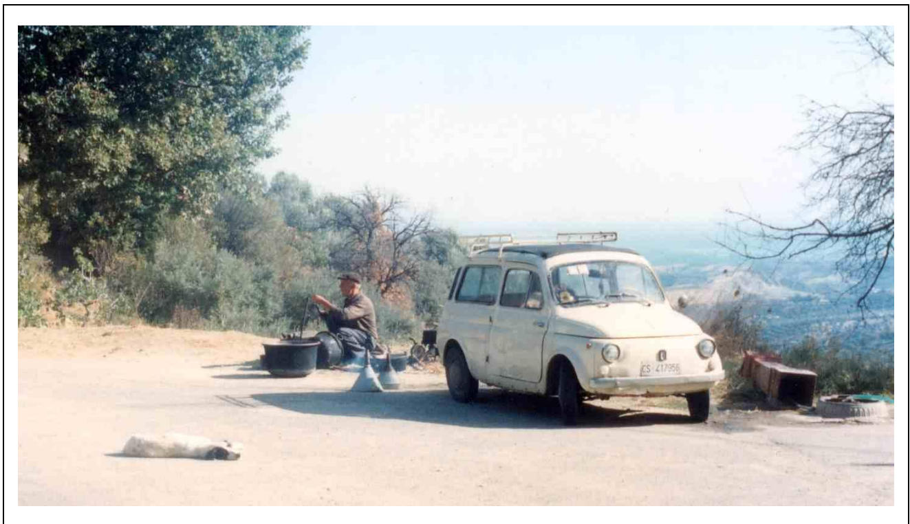
U quadararu a Makij anni 1990