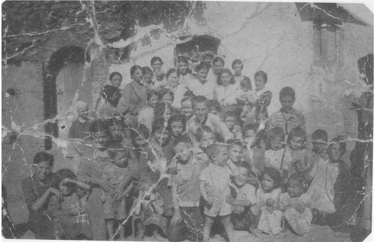
Una foto di gruppo di gjitoni a Makij – 1940