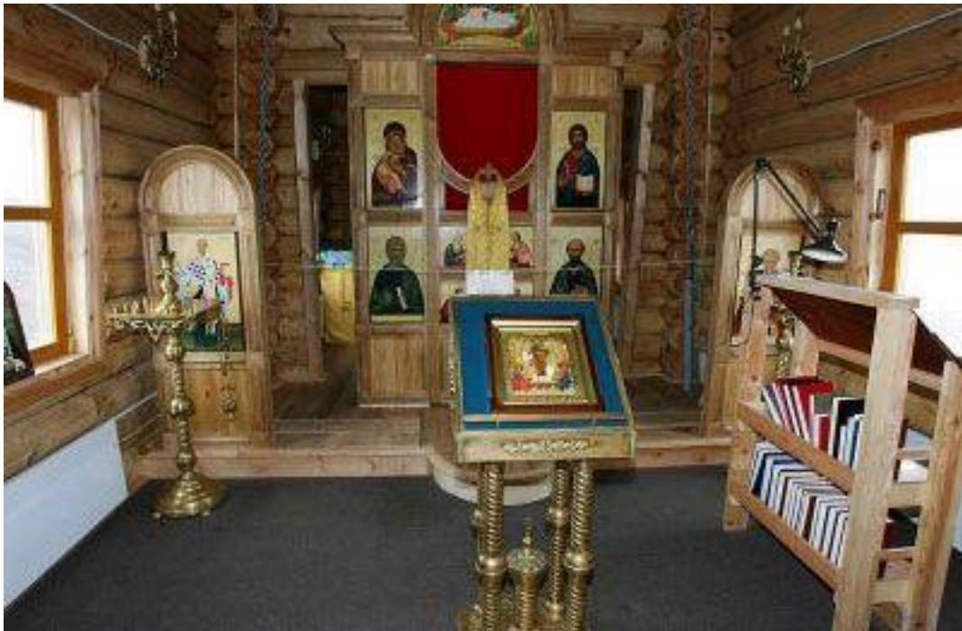
Interno del Khatolikon