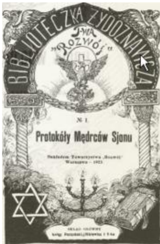
Il protocollo in un'edizione polacca

Dicono che I protocolli di Sion 1 siano un falso storico. Ammettiamo pure che lo siano. Ma un po' di attenzione, "Gentili" signori: forse quanto scritto (almeno nella sua massima parte) non ha trovato poi una sua realizzazione?