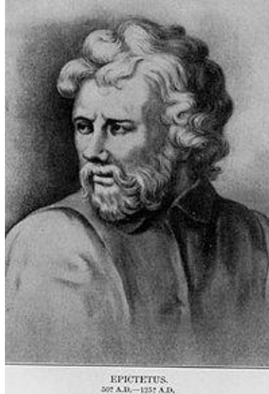
Ritratto del filosofo greco Epitteto ( Ierapoli , 50 – Nicopoli d'Epiro , 120 )

Le cose sono di due maniere; alcune in potere nostro, altre no. Sono in potere nostro l' opinione, il movimento dell'animo, l'appetizione, l'aversione, in breve tutte quelle cose che sono nostri propri atti. Non sono in poter nostro il corpo, gli averi, la riputazione, i magistrati, e in breve quelle cose che non sono nostri atti.