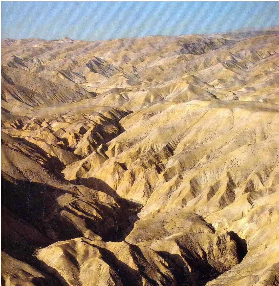
Il deserto del Negev (in Palestina)

Nell'iconografia viene rappresentata alcune volte come penitente presso una grotta con i capelli lunghi che le coprono il corpo, con tre pani che si portò nel deserto e a volte un leone che aiutò Zosima a seppellirla. E' diffusa anche l'immagine della Comunione portata da Zosima o dagli angeli." 2