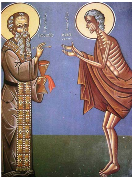
Icona raffigurante s. Zosima mentre dà l'eucarestia a santa Maria Egiziaca

E disse all'anziano: "Perdona, abba, e adempi un altro comando della mia richiesta: va' ora al monastero, guidato dalla pace di Dio; questo stesso giorno dell'anno che viene va' di nuovo a quel torrente presso il quale ti parlai la prima volta. Qualunque cosa avvenga non tralasciare di farlo, ma, per il Signore, vieni e mi vedrai di nuovo, come Dio vorrà. Egli allora le rispose: Oh se fosse possibile seguire ora le tue orme e fruire della visione del tuo preziosissimo volto! Ti prego, madre, adempi a una sola piccola richiesta di questo anziano e degnati di prendere un po' del cibo che qui ti ho portato". E dicendo queste cose le mostrò il canestro che aveva portato con sé. Lei, allora, toccò con la punta delle dita le lenticchie e prendendo tre grani se li portò alla bocca, dicendo che era sufficiente la grazia dello Spirito per custodire senza macchia la sostanza dell'anima. Allora disse all'anziano: 'Prega per tue, in nome di Dio, e ricordati sempre della mia miseria". Egli, toccando i suoi santi piedi, supplicava con lacrime che pregasse per la chiesa e per l'impero e per lui e così la lasciò andare piangendo e levando alti lamenti. Non osava, infatti, trattenerne molto lei che neanche se avesse voluto poteva esser trattenuta.