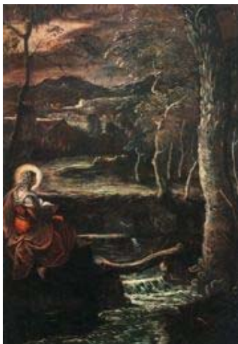
Opera del Tintoretto raffigurante Santa Maria Egiziaca (1582 - 1587).

6. Da ora, dunque riferirò come veniva osservata la tradizione di questo monastero. Nella domenica che, secondo la consuetudine, dà il nome alla prima settimana di digiuni, si celebravano come di norma i divini sacramenti e ognuno veniva reso partecipe del vivificante e incontaminato corpo e sangue del Signore nostro Gesù Cristo.