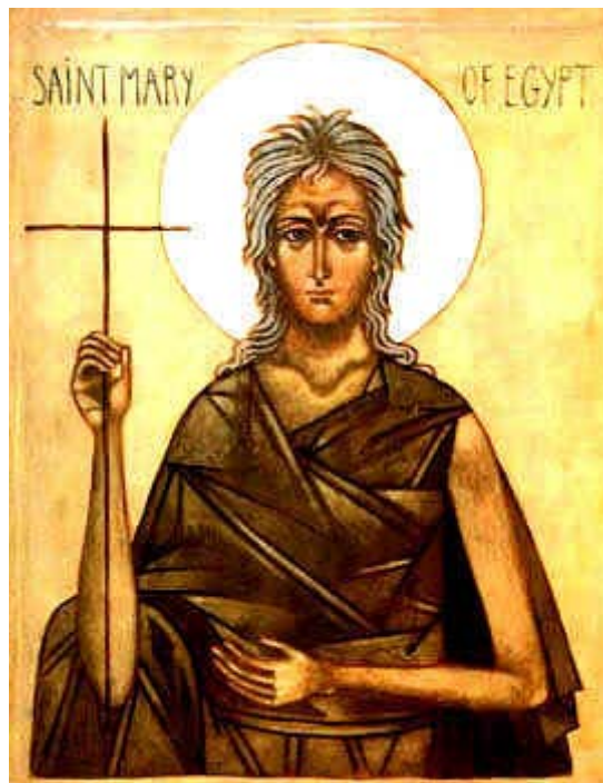
Icona di santa Maria Egiziaca

La memoria liturgica di santa Maria Egiziaca ricorre nella quinta domenica della Santa Quaresima di Pasqua